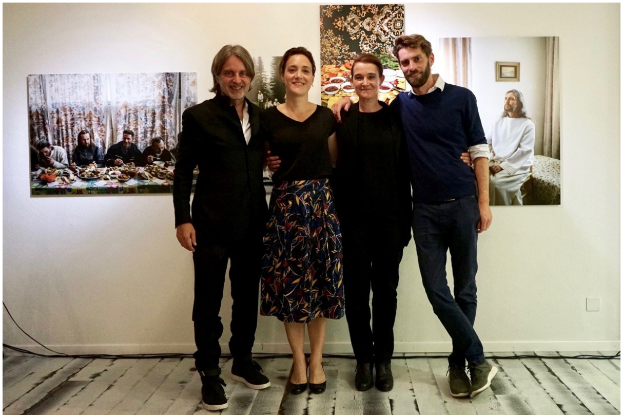
Frank Bodin/Präsident ADC Switzerland, Pauline Sain/Magnum Photos Paris, Melody Gygax/Magnum Photos Schweiz, Jonas Bendiksen/Magnum Fotograf