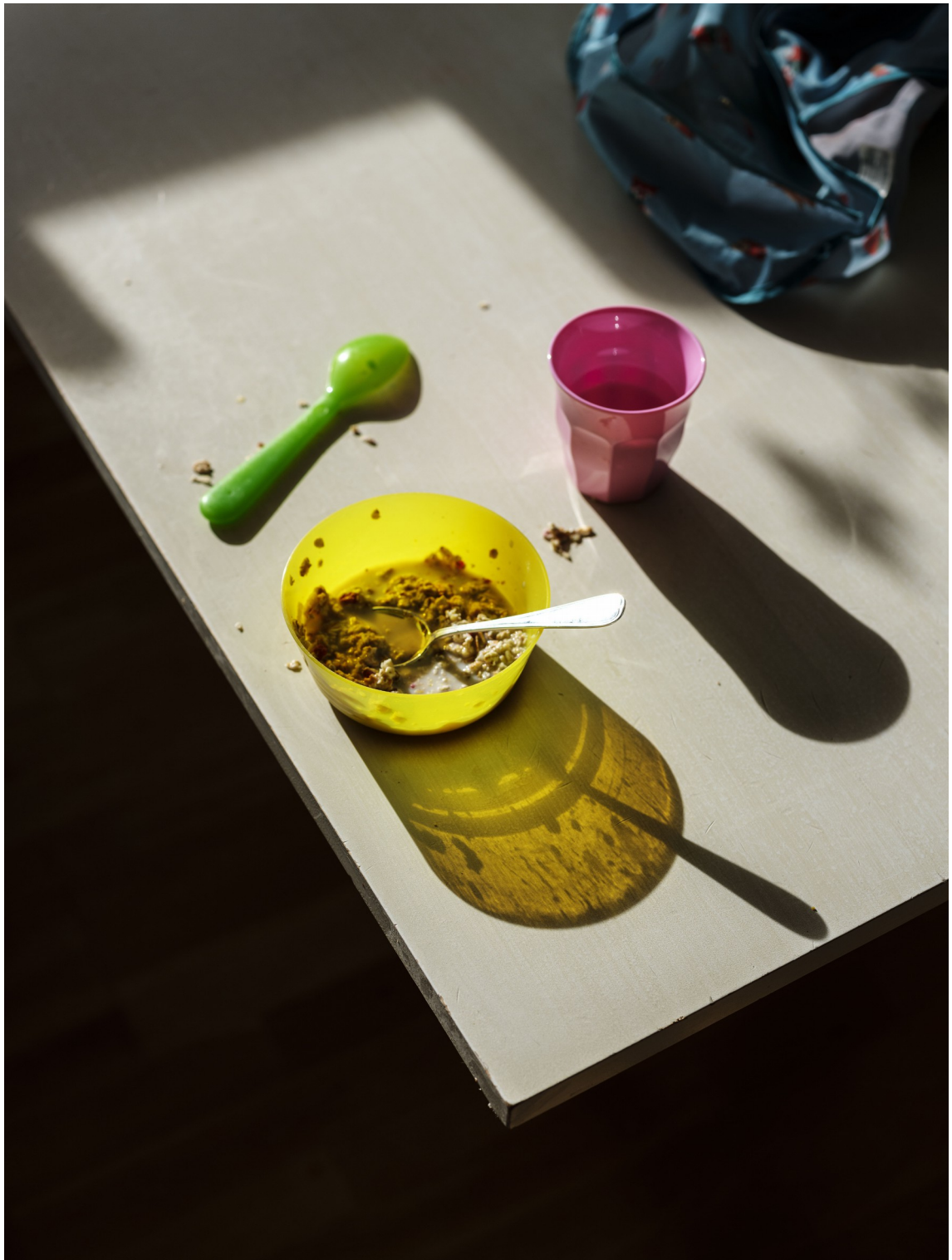
NORWAY. 2017. Nesodden. Frühstück.

Die ausgestellten Bilder von "THE LAST TESTAMENT" können als Sammlerabzüge in folgenden Auflagen und Größen in der ADC Gallery bestellt werden: