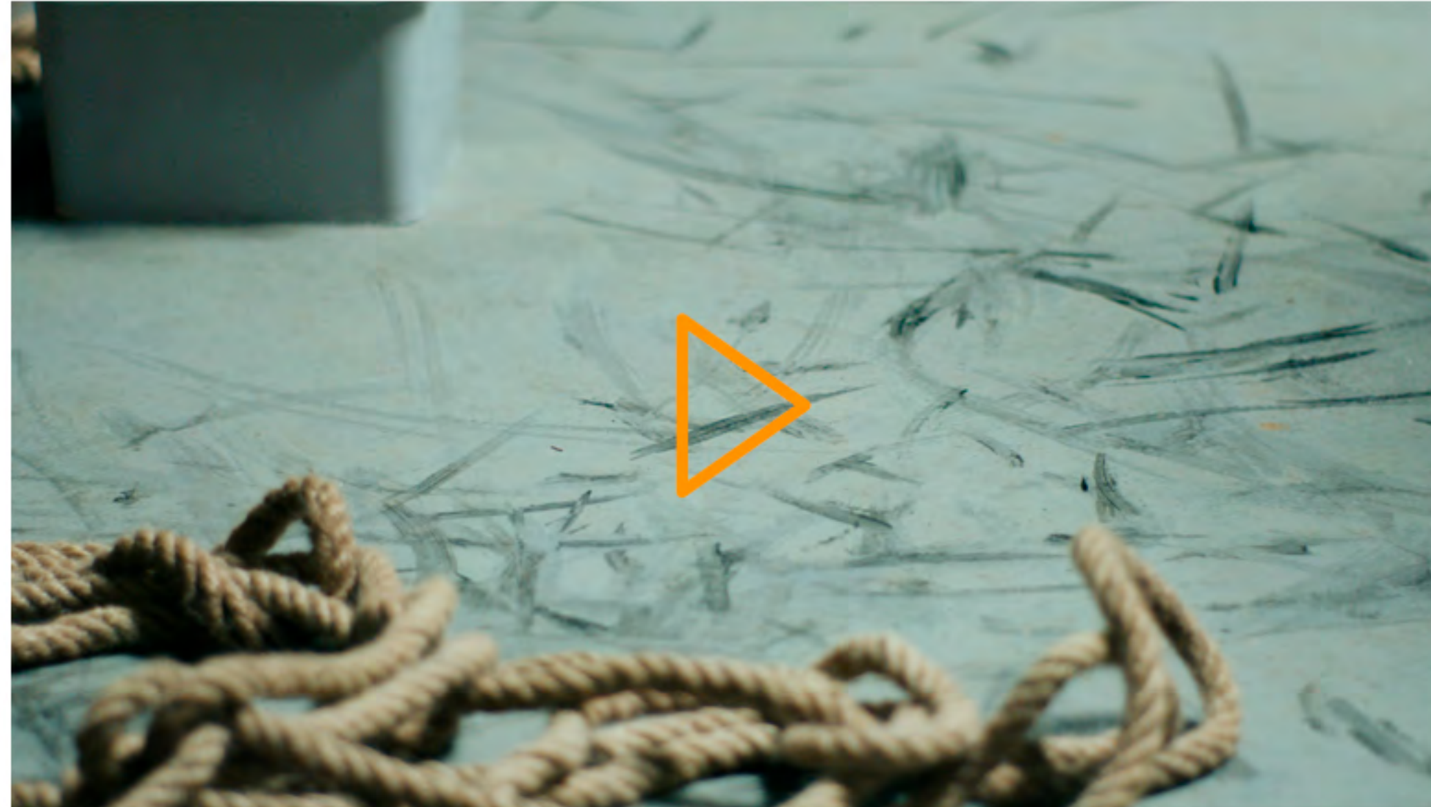
Striemen auf dem Boden.