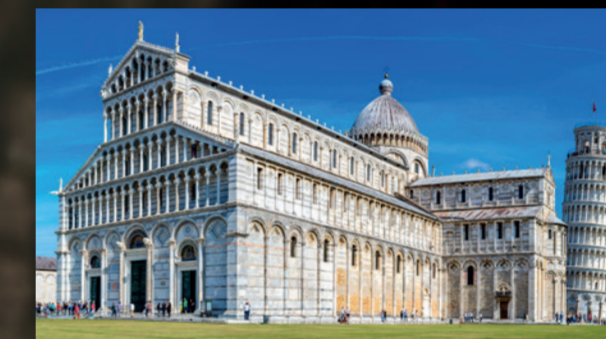
Die Renaissancestadt Pisa: Perfekte Ambiance für YuMi's Opernkonzert

Der Erfolg war überwältigend. Das Konzert erreichte die Medien rund um den Erdball. Die Berichte der TV-Stationen, Zeitungen, Online-Papers und sozialen Medien schufen rund um den Globus rund 673 Millionen Earned-Media-Kontakte.