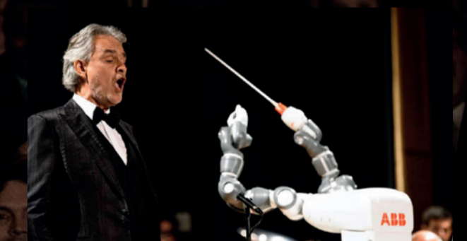
„La donna e mobile“: Andrea Bocelli und Dirigent YuMi