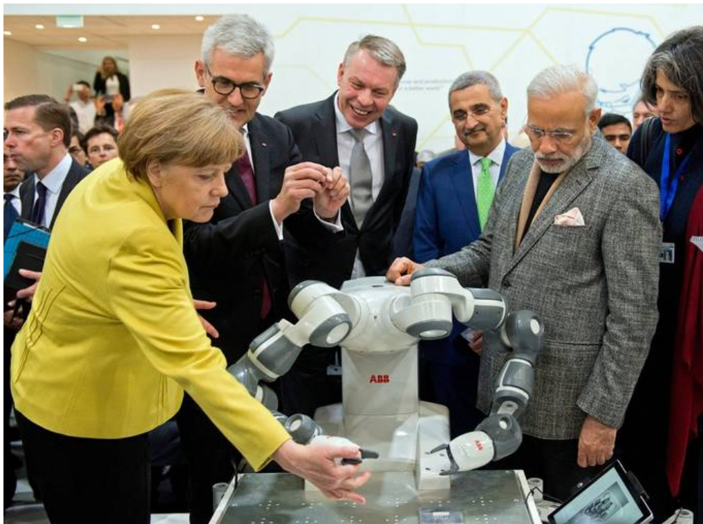
Angela Merkel hat Yumi schon die Hand geschüttelt: Zusammen mit ABB-CEO Ulrich Spiesshofer und Indiens Premierminister Narendra Modi besuchte sie den Stand der ABB an der Messe Hannover 2015.