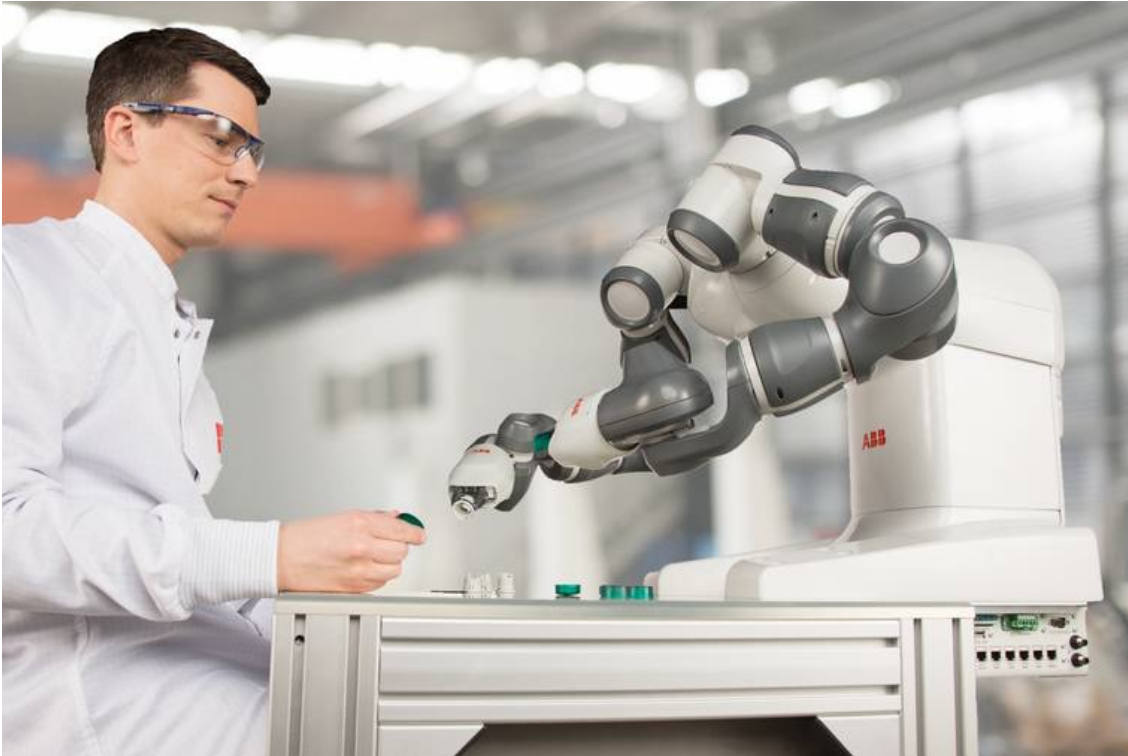
Yumi ist ein zweiarmiger Industrieroboter. Die ABB hat ihn 2014 lanciert.