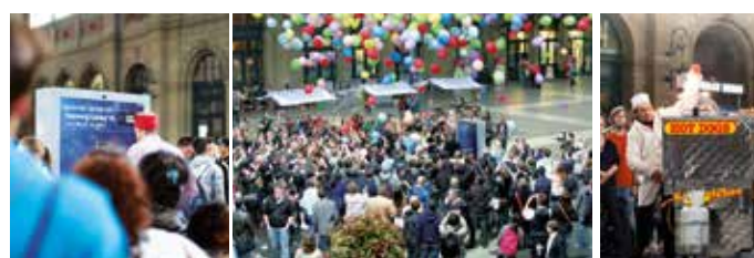
Ab Ende April 2012 warb die Berliner Agentur Heimat für den Privatkundenbereich der Swisscom. Was anfangs in der Schweizer Branche für heftige Reaktionen sorgte, hat sich zu einer fruchtbaren Zusammenarbeit entwickelt. Für am meisten Aufsehen sorgte die Aktion «All Eyes on S4», die im Mai 2013 im Hauptbahnhof Zürich durchgeführt wurde.