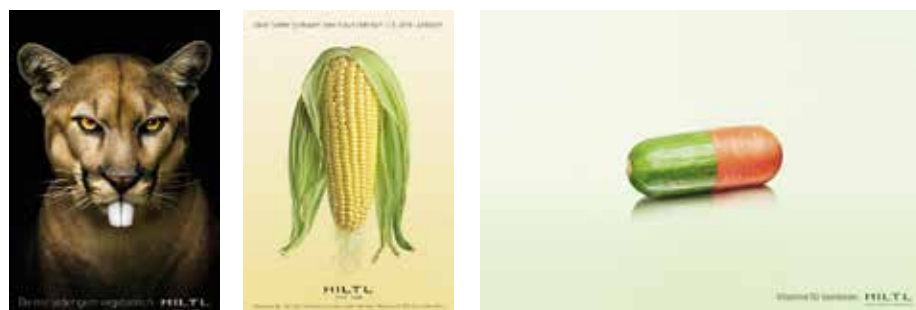
Jeder würde gerne für Hiltl werben: Die Zürcher Kreativagentur Ruf Lanz hat seit 2004 einen der begehrtesten Jobs der Branche. Die Werbekampagne wurde mehrfach ausgezeichnet.