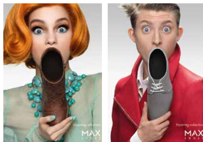
«Der Schrei» von Edvard Munch war nicht das Vorbild: Die POS-Kampagne von Jung von Matt/Limmat für Max Shoes sollte Neugierde wecken.