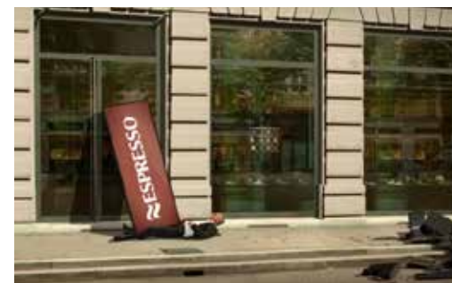
Die NGO Solidar Suisse setzte seit 2011 auf virale Onlinekampagnen – unter anderem von Spinax Civil Voices. Den Anfang machte der falsche George Clooney. Sein Malheur mit dem Nespresso-Schild sammelte auf Youtube mehrere Hunderttausend Klicks.