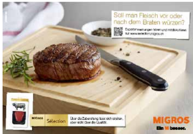
Kampagne der Zürcher Y&R-Gruppe, die seit ihrer Geburtsstunde im Jahr 2005 die Marketing- und Werbemaßnahmen der Sélection-Reihe der Migros betreute.