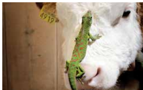
Seit 2009 dramatisierte die Zürcher Agentur Leo Burnett für Emmentaler Switzerland, unter anderem mit gezielt eingesetztem Humor wie bei den Fliegen fressenden Geckos.