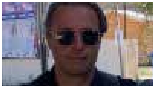
PHILIPP MÜLLER Fotograf

Als neues Jurymitglied möchte ich... oben Gesagtes unterstreichen. Anderen Jurymitgliedern gegenüber aus der Sicht eines leidenschaftlichen und kreativen Produzenten argumentieren.