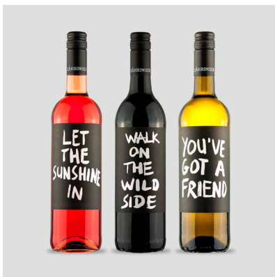
The 5th Dimension, Lou Reed, Carole King

Limitiert auf 1 Exemplar pro Song, Rückseite datiert & signiert EUR 460 | CHF 500 | $ 500 | £ 407