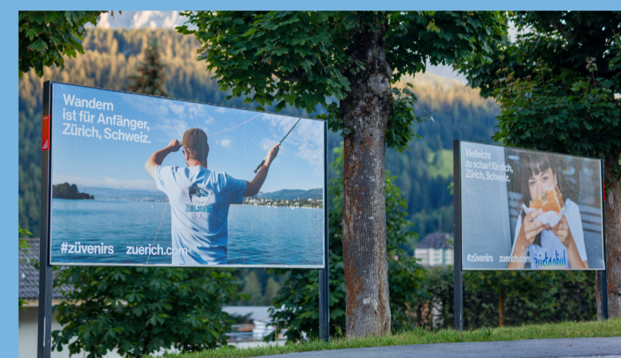
OOH platziert an viel frequentierten Ferien- und Ausflugsorten