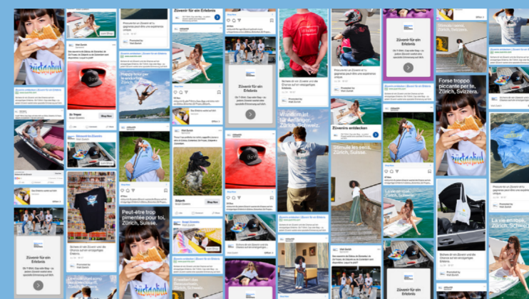
Perfekt targetierte und kontextbezogene Online-Ads